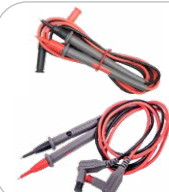
Komplet przewodów pomiarowych