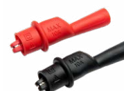
Krokodylek mini, 1 kV 10 A (kpl.)