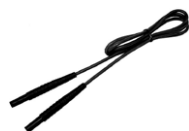
Przewód 1,2 m czarny 1 kV (wtyki bananowe)