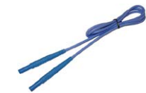
Przewód 1,2 m niebieski 1 kV (wtyki bananowe)