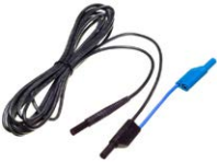
Przewód 5 m czarny 1 kV (wtyki bananowe, ekranowany)