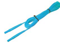
Przewód 5 m niebieski 1 kV (wtyki bananowe)