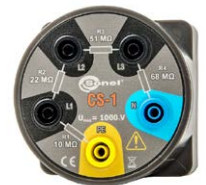
Symulator kabla CS-1