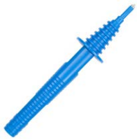
Sonda ostrzowa niebieska 1 kV (gniazdo bananowe)