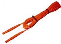
Przewód 5 m czerwony 1 kV (wtyki bananowe)