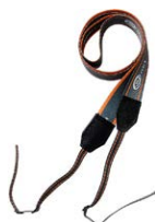
Szelki do miernika (typ M-1)