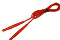
Cavo 1,2 m rosso 1 kV (terminali banana)