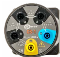
Adattatore cavo CS-1 WAADACS1