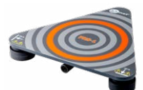
Sensore per misure della resistenza dei pavimenti e delle pareti PRS-1 WASONPRS1