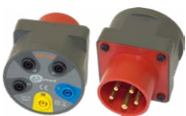
Adattatore AGT-16P (adattatore della presa trifase) WAADAAGT16P