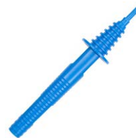
Terminale a puntale blu 1 kV (innesto a banana) WASONBU0GB1