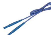
Cavo 1,2 m blu 1 kV (terminali a banana)