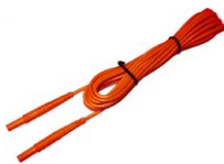
Cavo 5 m rosso 1 kV (terminali banana) WAPRZ005REBB