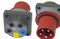
Adattatore AGT-63P (adattatore della presa trifase) WAADAAGT63P