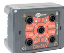
Adaptador caja de calibración CS 5 kV