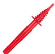
Sonda roja de punta 5 kV (toma tipo banana)