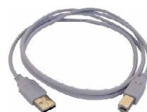
Przewód do transmisji danych USB