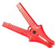
Krokodylek czerwony 11 kV 32 A