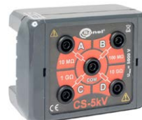
Skrzynka kalibracyjna CS-5kV