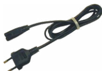
Przewód do zasilania 230 V (wtyk IEC C7)