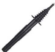
Sonda ostrzowa czarna 5 kV (gniazdo bananowe)