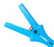
Krokodylek niebieski 11 kV 32 A