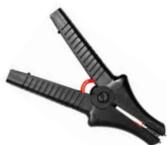
Krokodylek czarny 11 kV 32 A