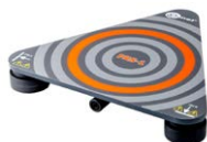
Sonda do pomiaru rezystancji podłóg i ścian PRS-1