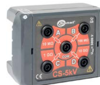
Skrzynka kalibracyjna CS-5kV