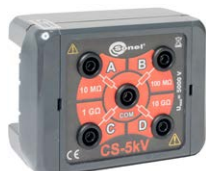
Adaptador caja de calibración 5 kV

WAPRZ003REBB10K WAPRZ005REBB10K WAPRZ010REBB10K WAPRZ020REBB10K