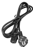
Cable de alimentación 230 V (conector Uni- Schuko/ IEC C13)