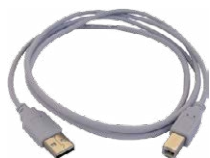
Cable de transmisión, terminado con conector USB