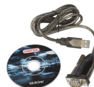
Cable de transmisión en serie RS-232