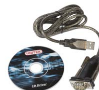
Cavo per trasmissio- ne seriale RS-232