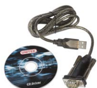
Adattatore USB / RS-232