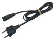
Cavo di rete 230 V (IEC C7)