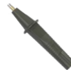
2x terminale a puntale doppio contatto Kelvin (innesti a banana)