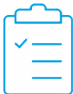
Certificato di cali- brazione di fabbrica