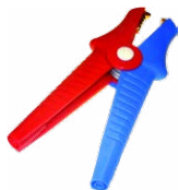
2 x terminale a coccodrillo Kelvin 1 kV 25 A