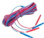
Cavo bifilare (10 / 25 A) U1 / I1 6 m / 10 m / 15 m

WAPRZ006DZBBU111 WAPRZ010DZBBU111 WAPRZ015DZBBU111