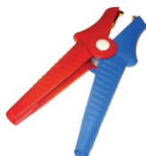
2 x Krokodylek Kelvina 1 kV 25 A