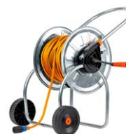
Przewód 50 m / 75 m / 100 m do pomiaru małych rezystancji oraz badania ochrony odgromowej turbin wiatrowych

WAADAPRZ050BDP WAADAPRZ075BDP WAADAPRZ100BDP