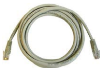
Przewód sieciowy LAN zakończony wtykami RJ45