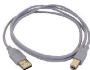
Przewód do transmisji danych USB