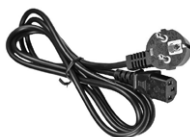
Przewód do zasilania 230 V IEC C13