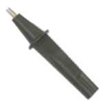
Sonda dwuostrzowa Kelvina (gniazda bananowe)