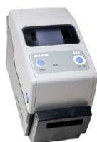
Drukarka raportów / kodów (USB, przenośna)

WAADAPRZ050BDP WAADAPRZ075BDP WAADAPRZ100BDP