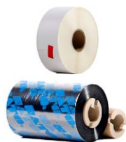
Taśma / papier do drukarki SATO (z klejem)