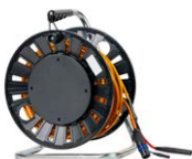
Przewód 25 m do pomiaru małych rezystancji oraz badania ochrony odgromowej turbin wiatrowych