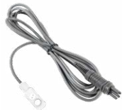
Sonda do pomiaru temperatury ST-3