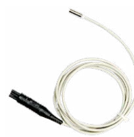
Sonda do pomiaru temperatury ST-1