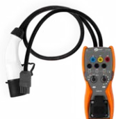
Adapter EVSE-01 do testów stacji ładowania pojazdów elektrycznych