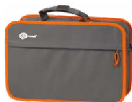
Futurał L2 standardowo dla MPI-520 opcjonalnie dla MPI-520 Start