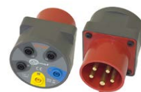
Adapter gniazd trójfazowych 16 A / 32 A