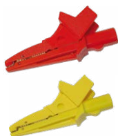
Krokodyłek 1 kV 20 A czerwony / żółty