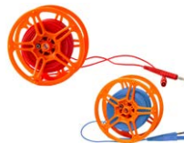
Przewód pomia- rowy na szpuli do pomiaru uziemień 25 m czerwony / niebieski