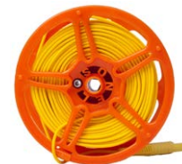
Przewód pomia- rowy na szpuli do pomiaru uziemień 50 m