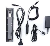
Komplet do ładowania (zasilacz+akumulator)