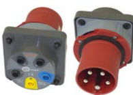
Adapter gniazd trójfazowych 63 A