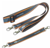
Szelki do miernika (typ L-2)