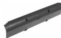
Pojemnik na baterie 4xLR14