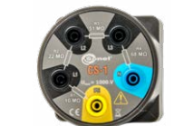
Symulator kabla CS-1