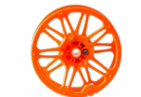
Szpula do nawi- nięcia przewodu pomiarowego