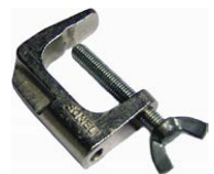
Zacisk imadłkowy (wtyk bananowy)