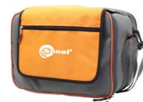
Futurał L4 opcjonalnie dla MPI-520 standardowo dla MPI-520 Start