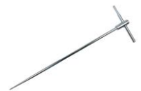
Sonda 80 cm do wbijania w grunt