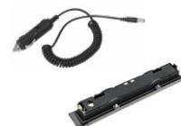
Cable para cargar la batería del mechero de coche 12 V