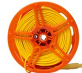
Cable para la medición de puestas a tierra 50 m