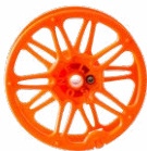
Carrete para enrollar el cable de medición