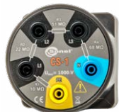
Simulador de cable CS-1