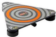
Sonda para medir la resistencia de suelos y paredes PRS-1