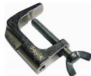
Mordaza (conector tipo banana)