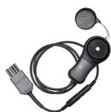
Sonda luxométrica LP-10A con clavija WS06