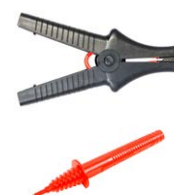
Cocodrilo 11 kV 32 A negro