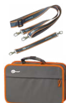
Arnés para el medidor (tipo L-2)