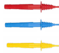
Sonda de punta 1 kV (toma tipo banana) roja / azul / amarilla