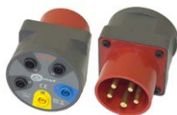
Adaptador para enchufes trifásicos 16 A / 32 A