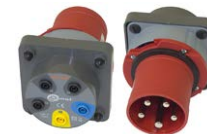
Adaptador para enchufes trifásicos 63 A