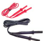
Cable 1,8 m 5 kV (conectores tipo banana) rojo / negro blindado