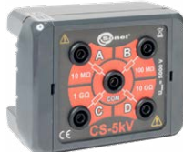
Caja de calibración CS-5kV