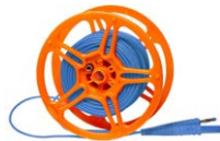
Cable para la medición de puestas a tierra 25 m