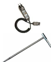
Adaptador WS-03 con botón que inicia la medición (CAT III 300 V)