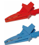
Cocodrilo 1 kV 20 A rojo / azul