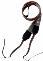
Arnés para el medidor (tipo M1)