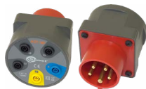
Adaptador AGT para enchufe trifásico 16A / 32A