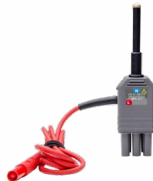
Adaptador WS-07 para medir la impedancia de bucle Z(L-N)