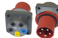
Adaptador AGT para enchufe trifásico 63 A