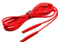
Cavo di prova per la misura dell'anello di guasto (terminale banana) 5 m / 10 m / 20 m