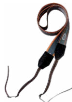
M1 cinghia di supporto