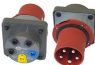
Adattatore presa trifase industriale 63 A