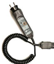
WS-03 adattatore con pulsante di START e spina UNI-SCHUKO