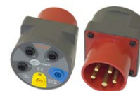
Adattatore presa trifase industriale 16 A / 32 A