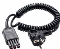
WS-04 adattatore con spina UNI-SCHUKO angolare