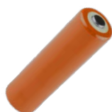
4x batterie LR6 1,5 V