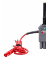
Adattatore WS-07 per la misura dell'impedenza dell'anello Z(L-N)