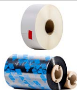
Akcesoria do drukarki SATO