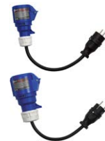
Adapter gniazd przemysłowych 3P