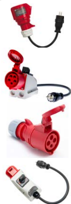
Adapter gniazd trójfazowych 32 A