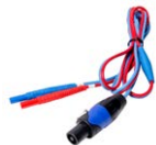
Przewód 1,5 m dwużyłowy (wtyk PAT/bananki)