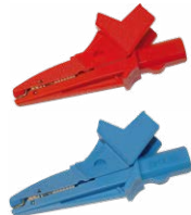
Krokodylek 1 kV 20 A

czerwony WAKRORE20K02 niebieski WAKROBU20K02