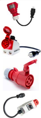
Adapter gniazd trójfazowych 16 A