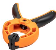
Abrazadera de montaje del medidor de radiación solar para paneles fotovoltaicos