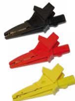
Cocodrilo 1 kV 20 A negro / rojo / amarillo