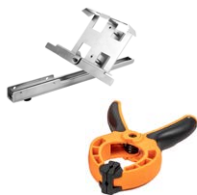
Kit de montaje de medidor de radiación solar para paneles fotovoltaicos