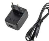
Fuente de alimentación de 5 V con salida USB 2.0 y cable micro-USB desmontable