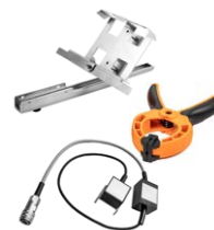
Kit de montaje de medidor de radiación solar para paneles fotovoltaicos + sonda para medir la temperatura de los paneles fotovoltaicos y el medio ambiente