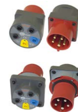
Adaptador para enchufes trifásicos 16 A / 32 A