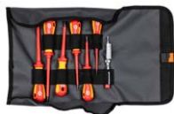
Zestaw NZ-2 WNZ2