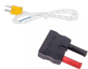
Pomiar temperatury Sonda (typ K) WASONTEMK Adapter WAADATEMK