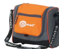
Futerał M-6 WAFUTM6